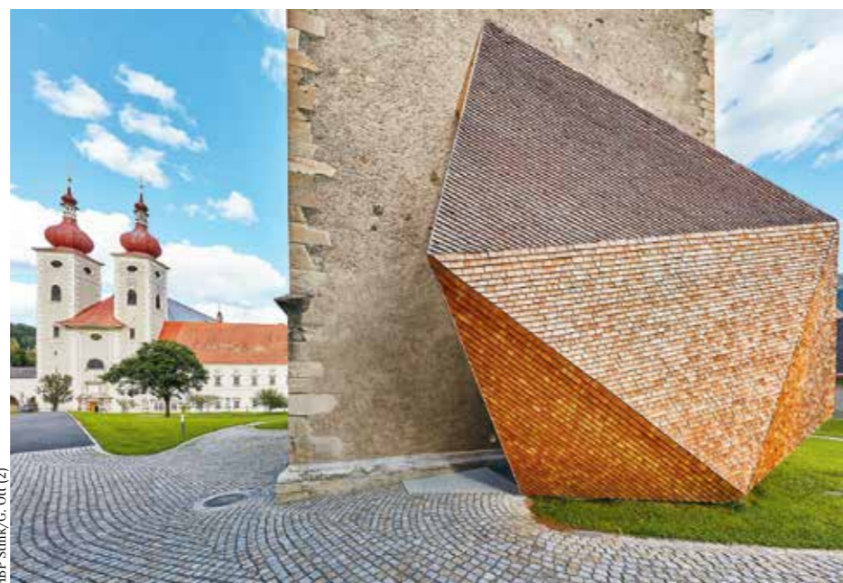
HBP Simk/G. Ott (2)

Verein der Freunde – „Peterskirche“: AT59 3823 8000 0200 3473