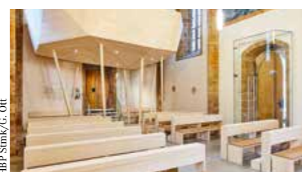
HBP Smik/G. Ort

Schriftbänder Triumphbogen 2.500,- bereits vergeben: Gewölbefresken Apsis, Deckenfresken und Wandmalereien (im Wert von 27.000,-)